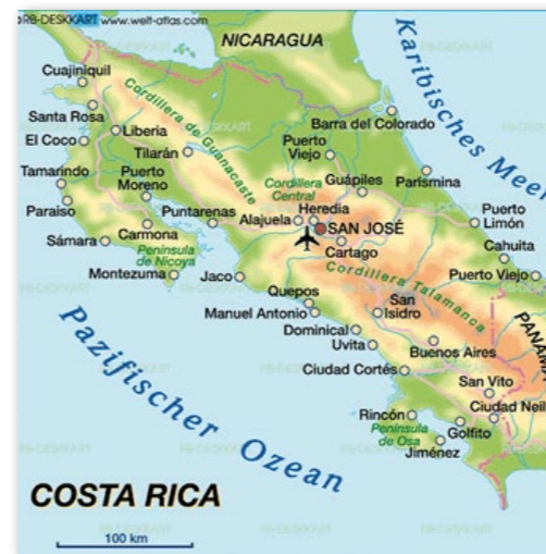
Costa Rica – zwischen Nicaragua und Panama einerseits und Karibischem Meer und Pazifik andererseits gelegen.