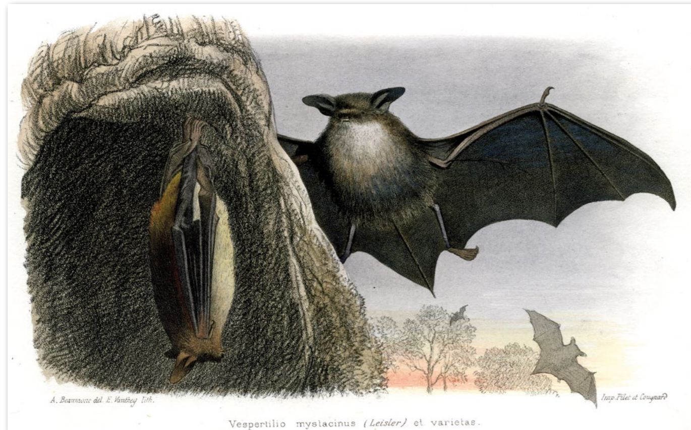
V. Faune des Vertébrés de la Suisse, Mammifères, Genève 1869

Die Auflösung finden Sie auf www.verein-fledermausschutz.ch / Angebote.