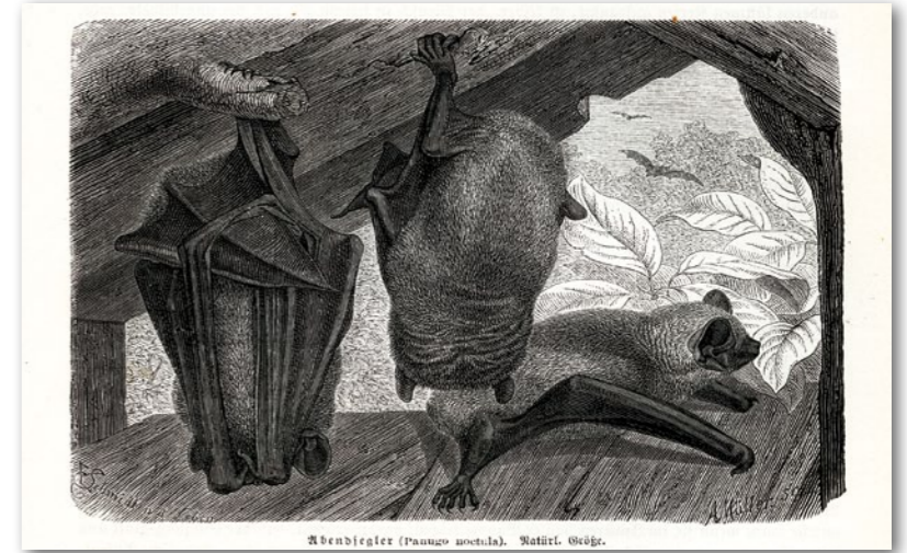
Brehms Tierleben, Säugethiere, Erster Band, Leipzig 1876

Sonnenscheine nur mit Mühe; sie aber erspürt dieselben bei finsterrer Nacht. Wir stolpern in der Dunkelheit oft auf ebenem Wege; sie schwirrt in der Nacht zwischen den Zweigen der Bäume hindurch. Von fern schon vernimmt sie das Summen des Mückenschwarmes und des einsamen Käfers, sowie den leisen Flügelschlag der Eule, welche ihr mit Klaue und Schnabel droht.